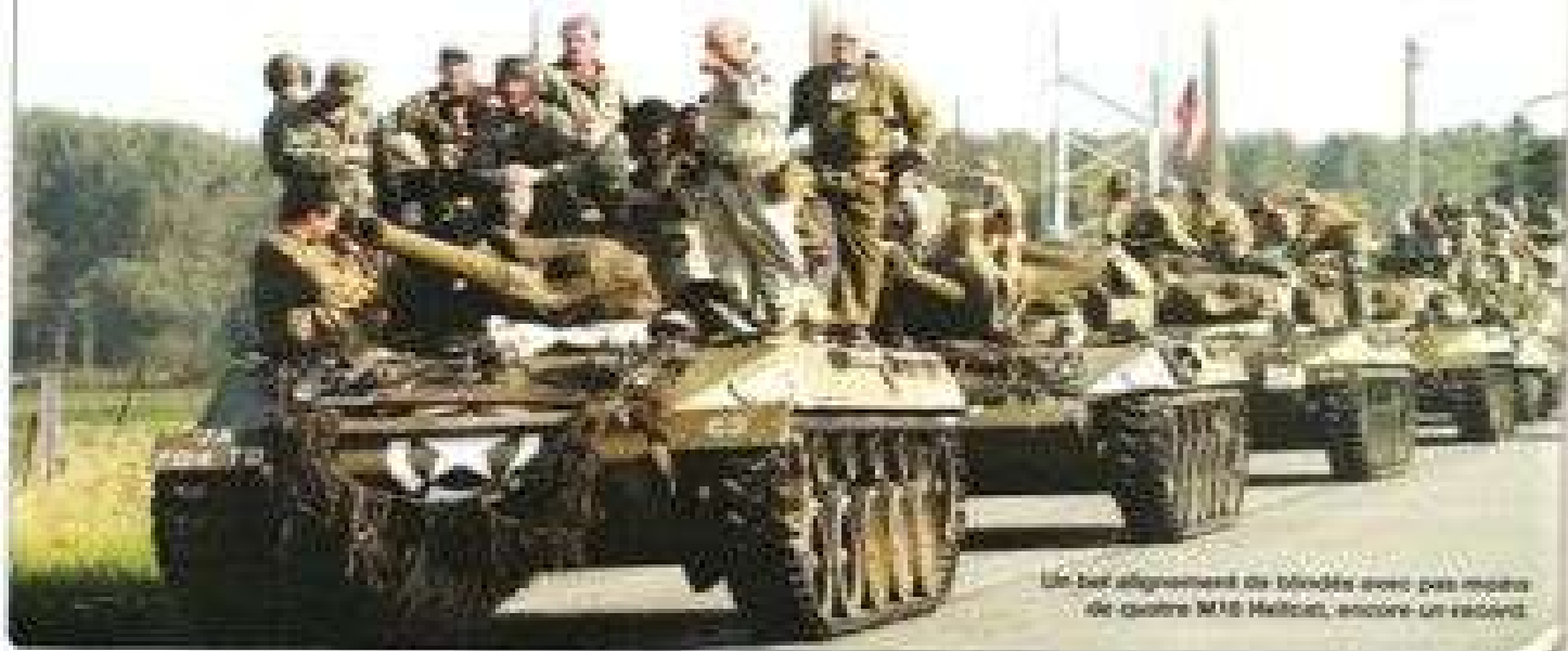
Un bel alignement de blindés avec pas moins de quatre M18 Hellcat, encore un récent.

Le mot, avec les remerciements à la tête d'une liste pour les amis et les collègues de l'opération et leurs champs et la route sur la Pa-