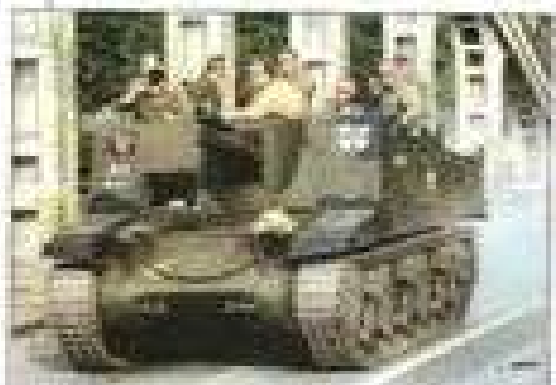
Le Serdar de Maurice Crockaert, des Foye-Bos, à pleine vitesse.

ce de l'école. On avait la permission sur la place, et un Fougy Magasin de la cathédrale des « Foye-Bos » de l'armée de l'Air belge qui avait prévu une future collaboration avec « Tania et Tanya ».