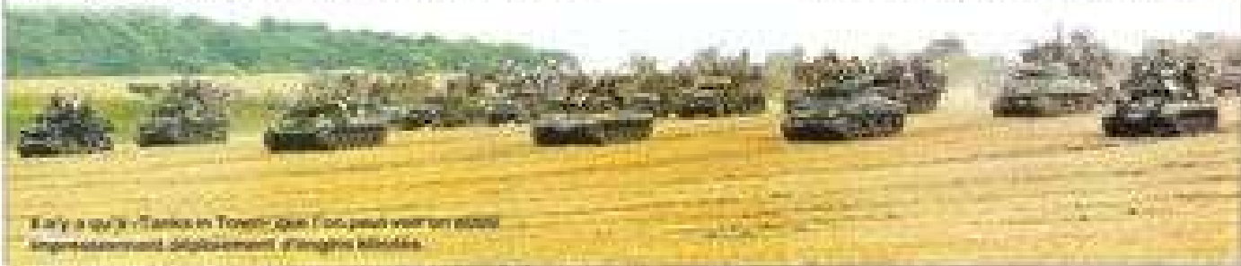
Il n'y a qu'à "Tanks in Town" que l'on peut voir un blindé impressionnant défilant devant d'ingénieurs militaires.

Les visiteurs qui sont venus sur le site du "Tanks in Town" à la fin de l'été, ont pu assister à une démonstration des chars Sherman et de leurs équipages effectuant leur tactique de blindé. C'était