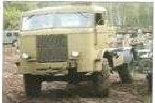
Cetengin n'est pas un blindé mais un très rare tracteur FWD 5/10 ton qui appartient à collectionneur belge.