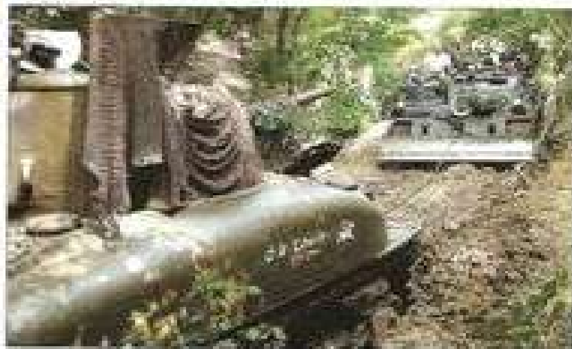
La pluie qui était tombée dans la semaine avait rendu certains passages difficiles. Ce fut une belle occasion de voir le Bergevoert van l'armée belge en action comme ici, en train de porter un Sherman d'un mauvais pas.